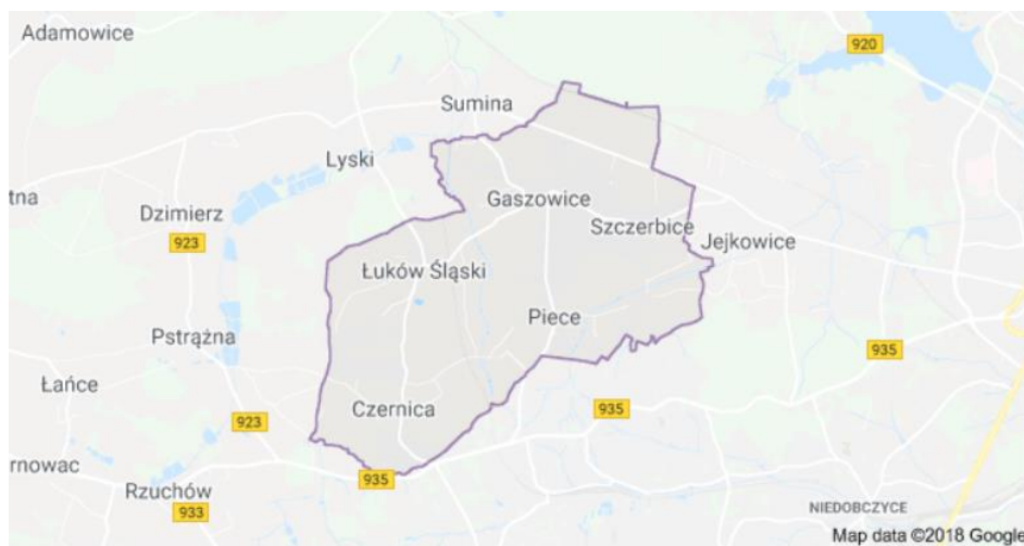
Rysunek 1. Mapa Gminy Gaszowice

Szczegółowa lokalizacja i inne dane dla danej lokalizacji zostały przedstawione w załączniku do PFU.