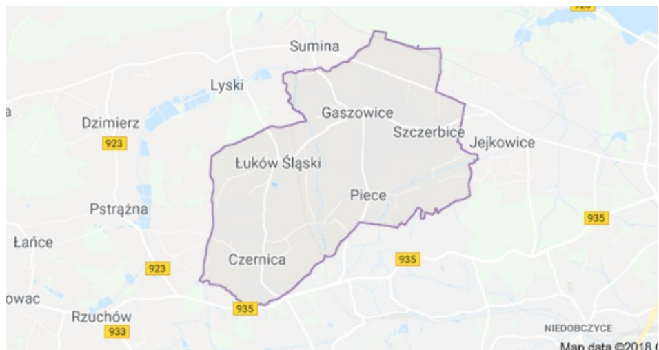
Rysunek 1. Mapa Gminy Gaszowice.

Szczegółowa lokalizacja i inne dane dla danej lokalizacji zostały przedstawione w załączniku do PFU.