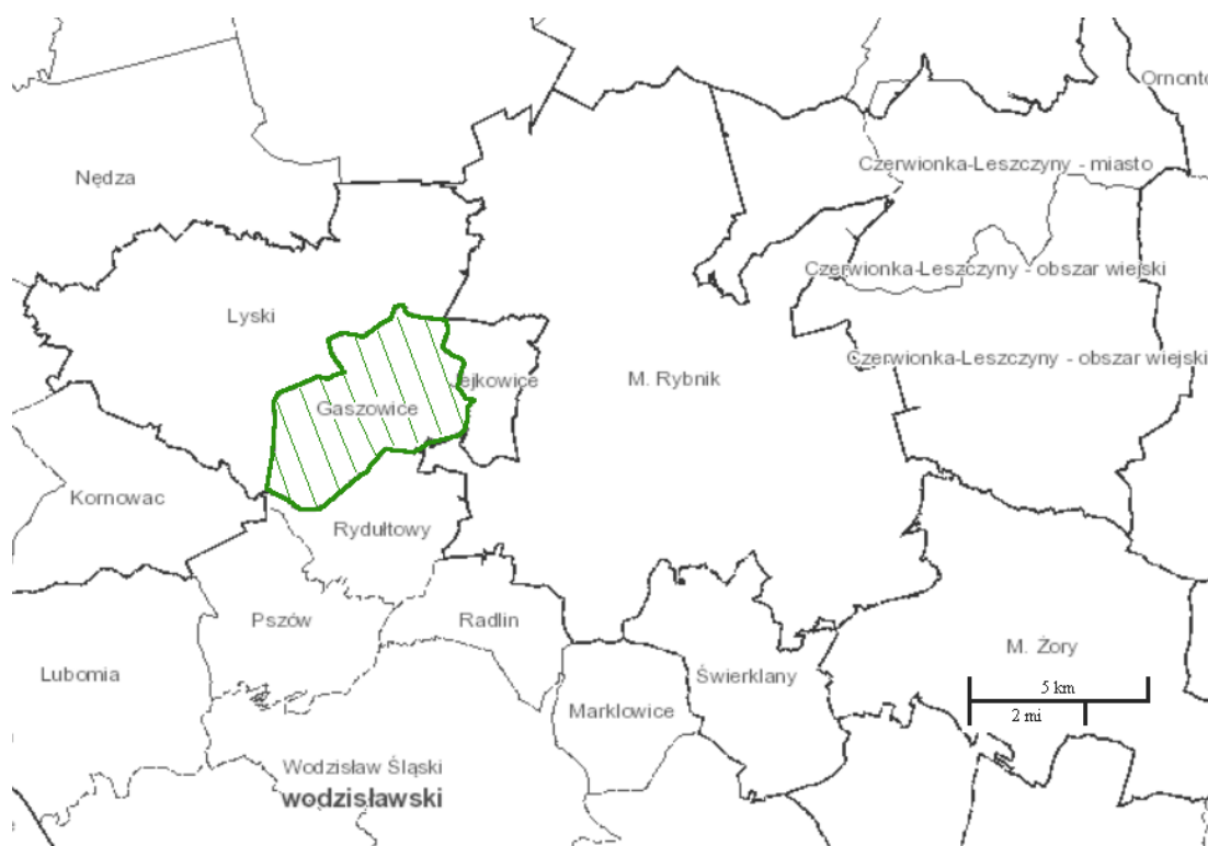
Rysunek 1. Lokalizacja Gminy Gaszowice na tle sąsiednich gmin i powiatów

Gmina Gaszowice jest gminą wiejską położoną w zachodniej części powiatu rybnickiego. W jej skład wchodzi 5 sołectw: Gaszowice, Szczerbice, Piece, Czernica i Łuków Śląski. W 2012 roku liczba mieszkańców gminy wyniosła 9200 osób (GUS, stan na dzień 31 XII 2012 r.). Powierzchnia gminy to 1985 ha, co stanowi ok. 9% powierzchni powiatu rybnickiego. Gmina graniczy: od zachodu i północy z gminą Lyski, od wschodu z gminą Jejkowice natomiast od południa z Miastem Rydułtowy (powiat wodzisławski) i Miastem Rybnik. Położenie gminy na tle powiatu i sąsiednich gmin przedstawiono na rys. 1 .