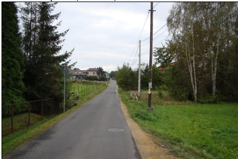
Fot. 2 Ul. Łączna, widok w kierunku południowym