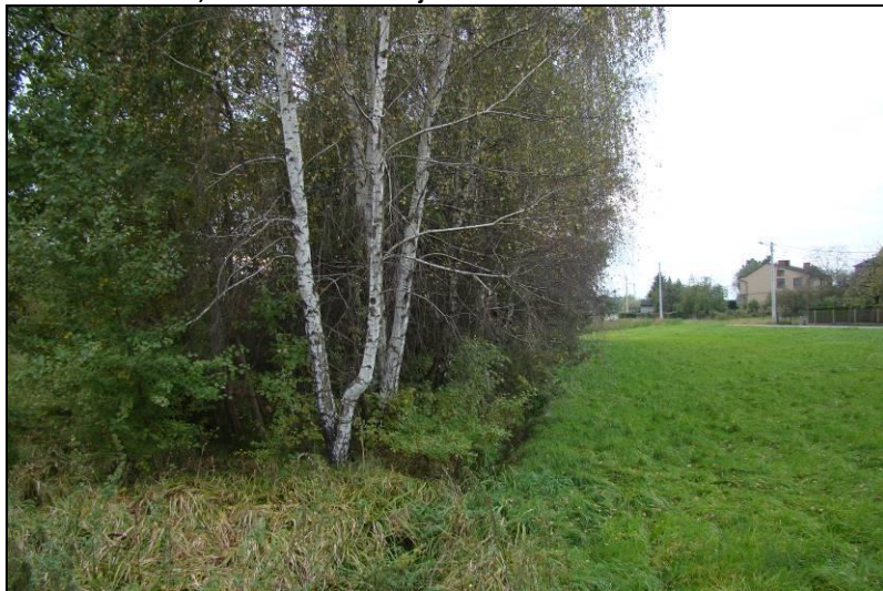
Fot. 10 Dolinka cieku, widok z ul. Łącznej