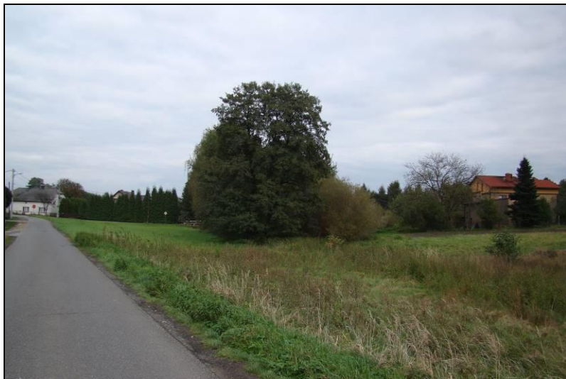
Fot. 9 Dolinka cieku, widok z ul. Granicznej w kierunku wschodnim