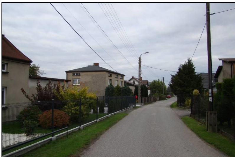
Fot. 5 Ul. Szkolna, widok w kierunku wschodnim