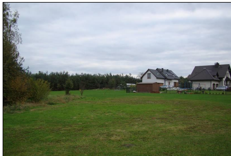
Fot. 7 Widok na północno-zachodnią część terenu z ul. Granicznej