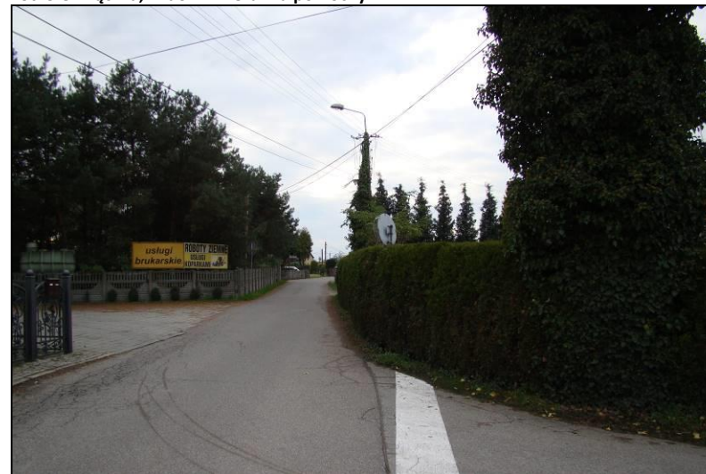
Fot. 4 Ul. Szkolna, widok w kierunku zachodnim