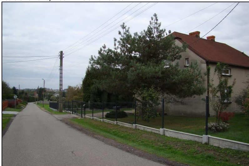
Fot. 6 Ul. Graniczna, widok w kierunku północnym