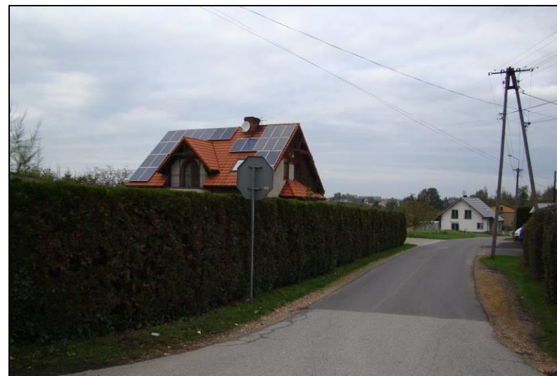
Fot. 3 Ul. Łączna, widok w kierunku północnym