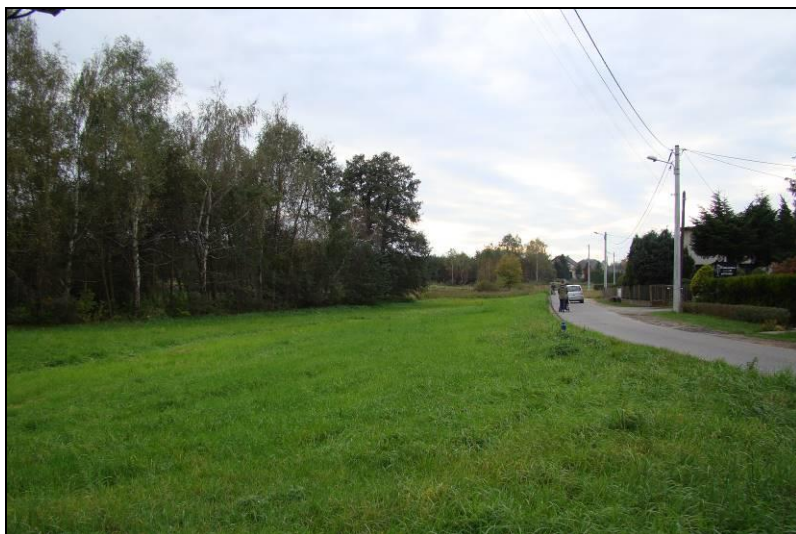
Fot. 1 Północna część terenu, ul. Graniczna, widok w kierunku zachodnim