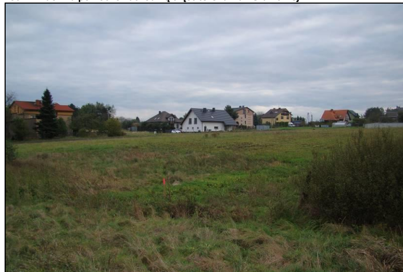
Fot. 8 Widok na centralną część terenu z ul. Granicznej