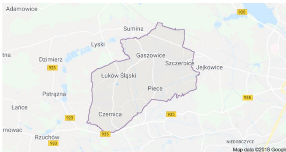
Rysunek 1. Mapa Gminy Gaszowice

Szczegółowa lokalizacja i inne dane dla danej lokalizacji zostały przedstawione w załączniku do PFU.