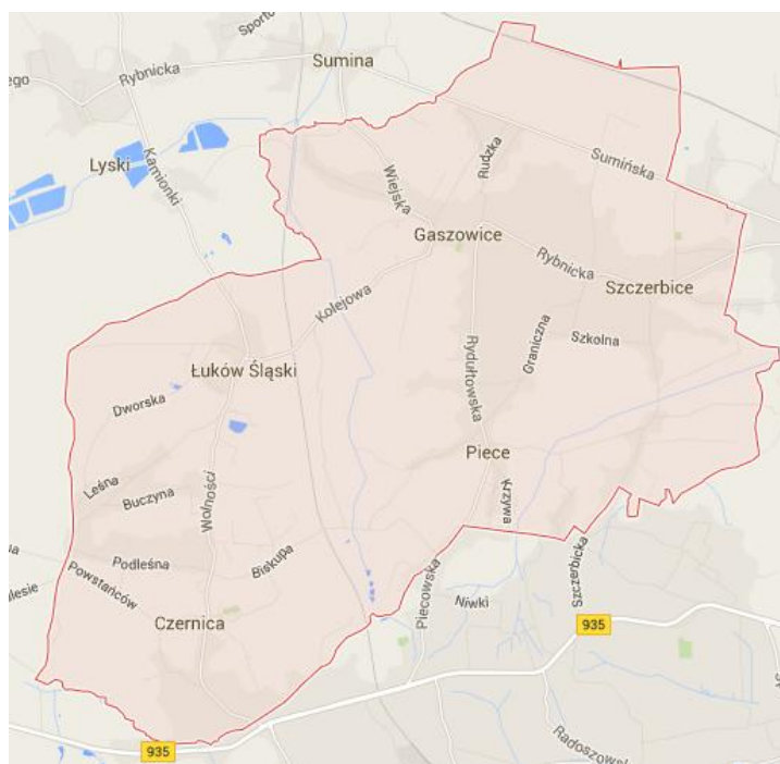
Rysunek 5.1-2 Mapa poglądowa Gminy Gaszowice

Gmina graniczy: od zachodu i północy z gminą Lyski, od wschodu z gminą Jejkowice oraz od południa z Miastem Rydułtowy (powiat wodzisławski) i Miastem Rybnik. Gmina podzielona jest na 5 sołectw: Gaszowice, Szczerbice, Piece, Czernica i Łuków Śląski.