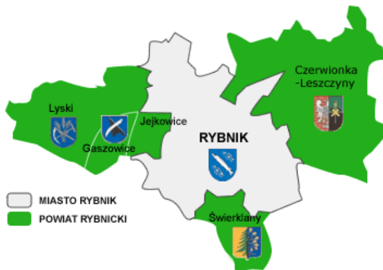
Rysunek 5.1-1 Położenie gminy Gaszowice w powiecie rybnickim

Gmina Gaszowice należy do powiatu rybnickiego. Położona jest w południowo-zachodniej części województwa śląskiego. Zajmuje ona powierzchnię 19,85 km 2 .